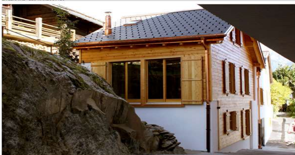
LA LENAIRE - LES MARECOTTES